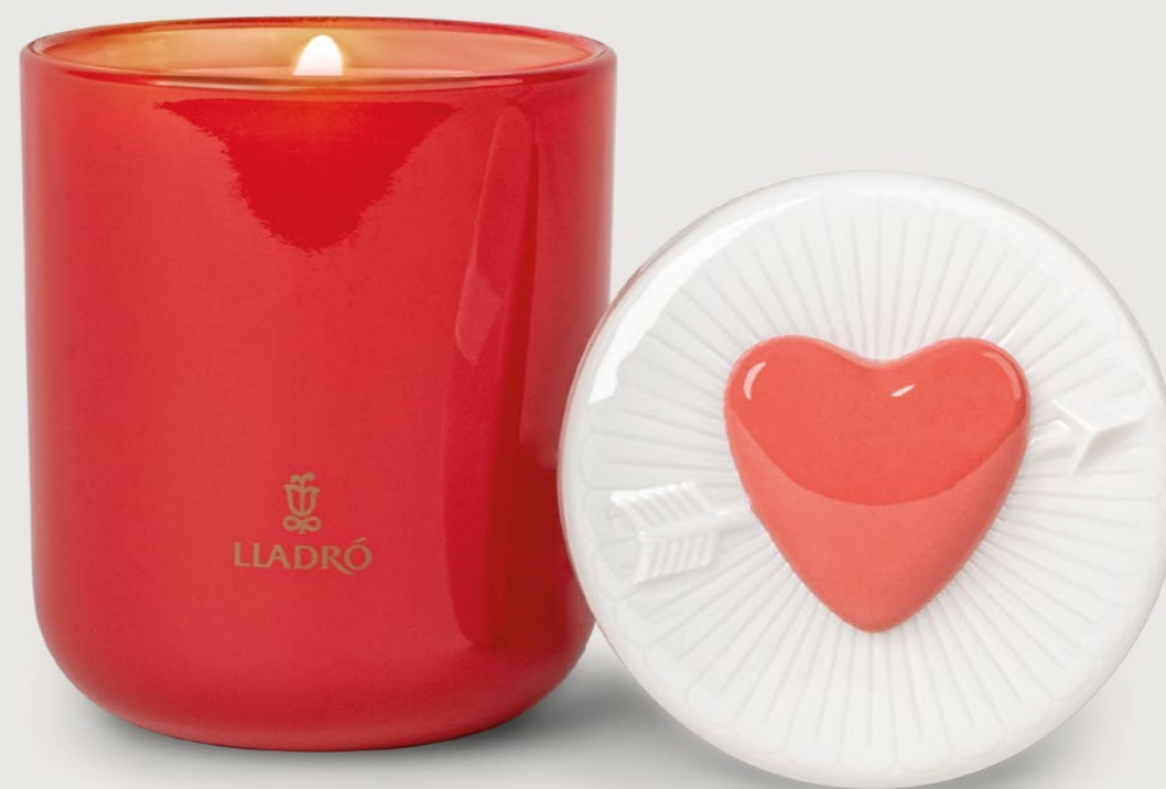
VELA FLECHAZO - LUZ DE LUNA 01040310 12 x 8 x 8 cm

La tapa de porcelana está grabada a mano con un corazón, decorado con un color rojo intenso, atravesado por una flecha. Un regalo perfecto para expresar amor y crear un ambiente envolvente con su perfume.