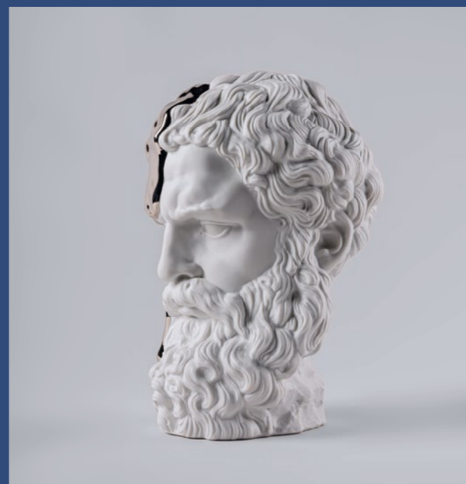
ETERNAL FLUIDITY - PENSADOR 01009732 31 x 20 x 22 cm

Los sabios antiguos nos transmitieron que la realidad está hecha de devenir y permanencia. Existen verdades esenciales, inmutables, pero también un tiempo que no se detiene y al que debemos adaptarnos. Las obras que componen la colección Eternal Fluidity se inspiran en esa ancestral sabiduría para crear una alegoría del clasicismo que convive con la innovación, de lo primordial que se abraza al fluir constante del cambio.