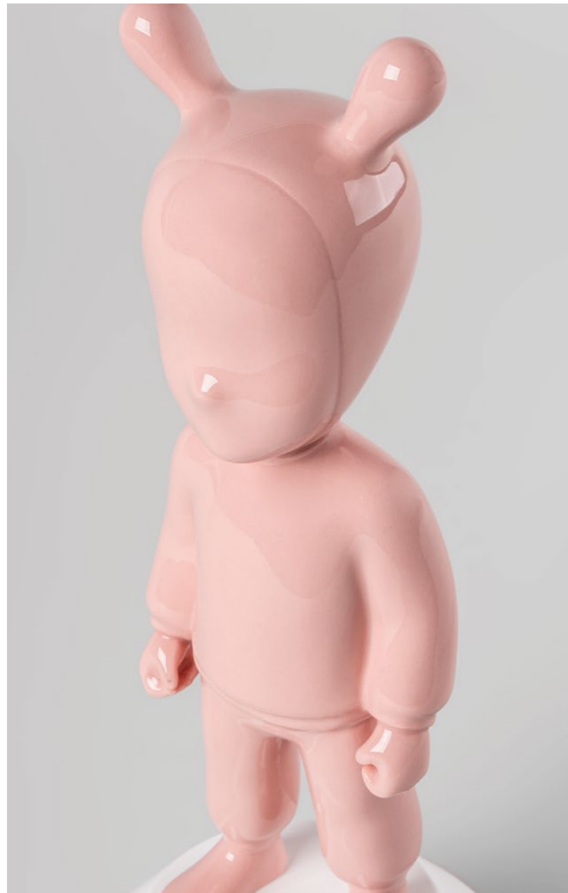
THE PINK GUEST-LITTLE 01007763 30 x 11 x 11 cm