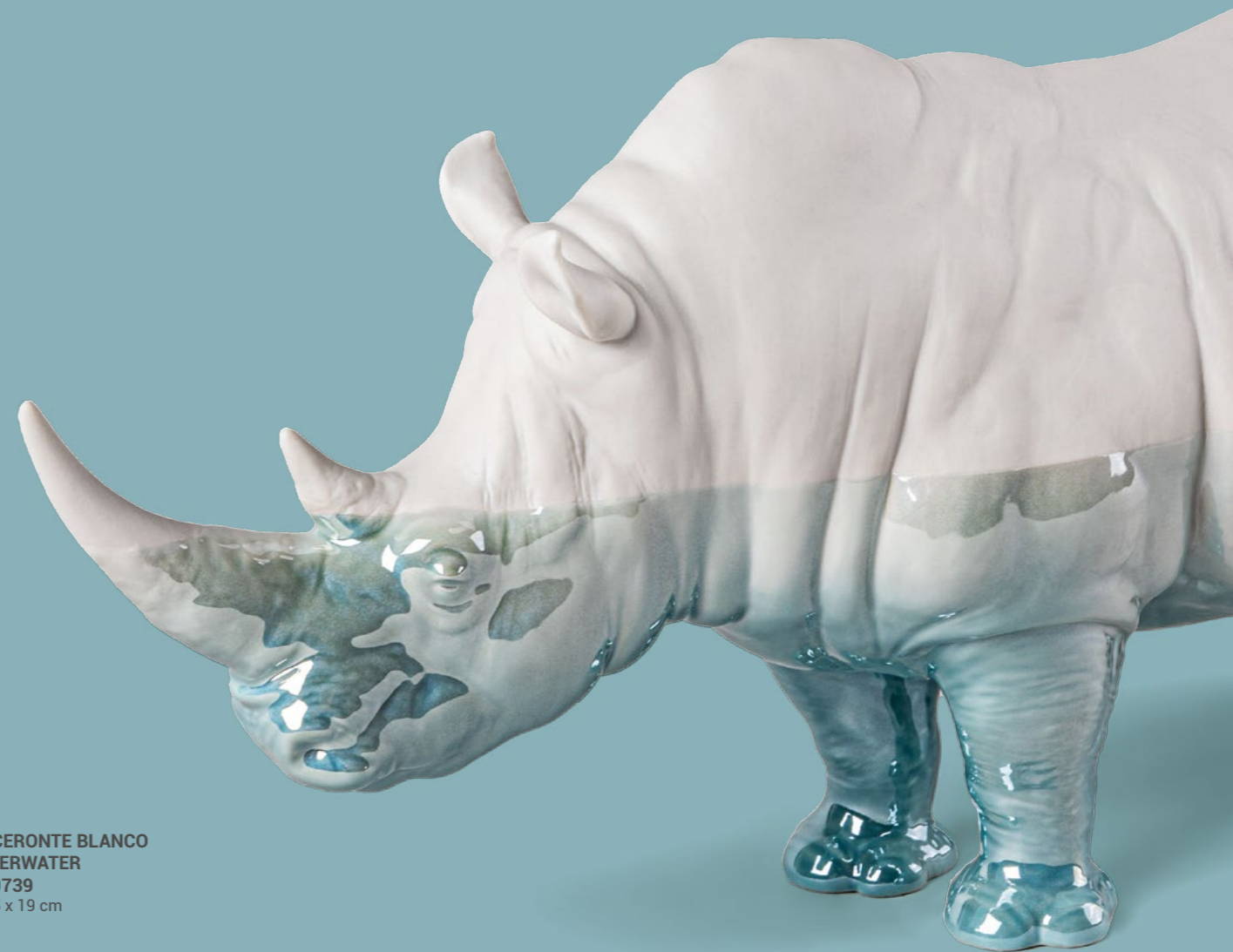
RINOCERONTE BLANCO - UNDERWATER 01009739 22 x 45 x 19 cm

A la perfección de las formas, se añade una deslumbrante decoración en tonos azules degradados que logra un efecto casi real de inmersión en el agua. El resultado, unas creaciones contemporáneas que no solo embellecen, sino que también cautivan con su magnífica elaboración artesanal en porcelana y con su mensaje.