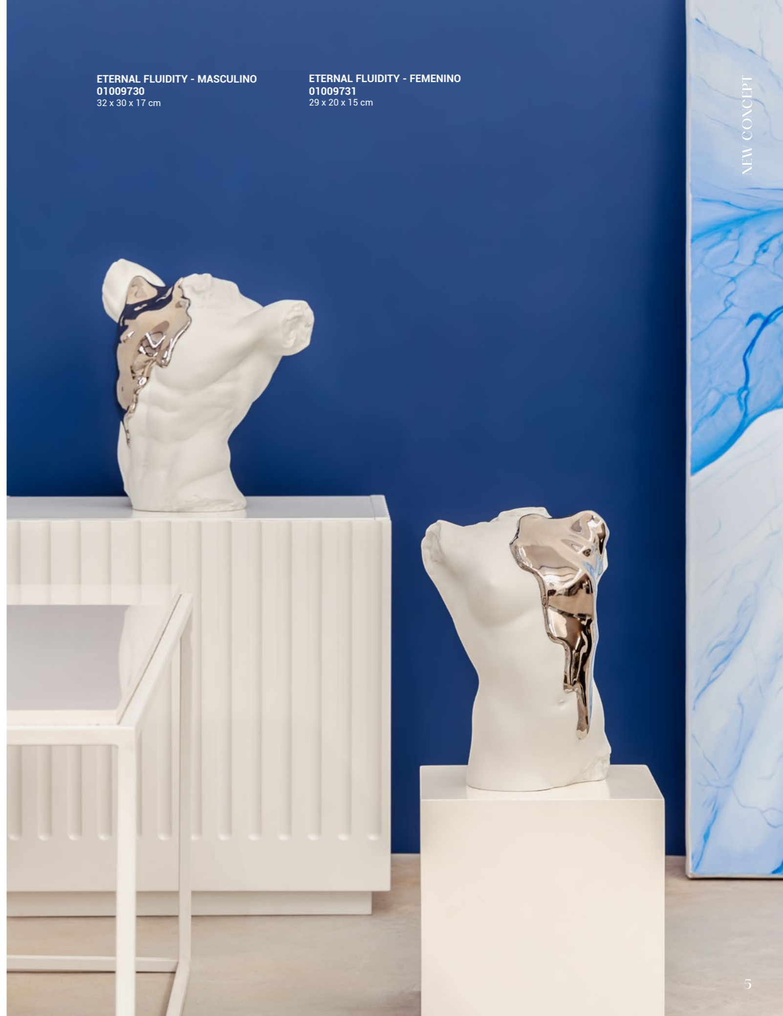
ETERNAL FLUIDITY - FEMENINO 01009731 29 x 20 x 15 cm