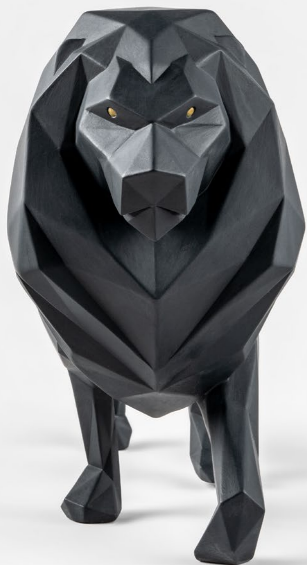
LEÓN (NEGRO MATE) 01009746 25 x 48 x 14 cm