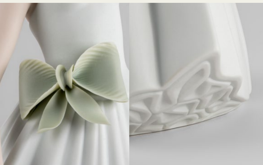
PIEZA ANUAL 2022 NOCHE DE GALA 01009567 34 x 26 x 15 cm