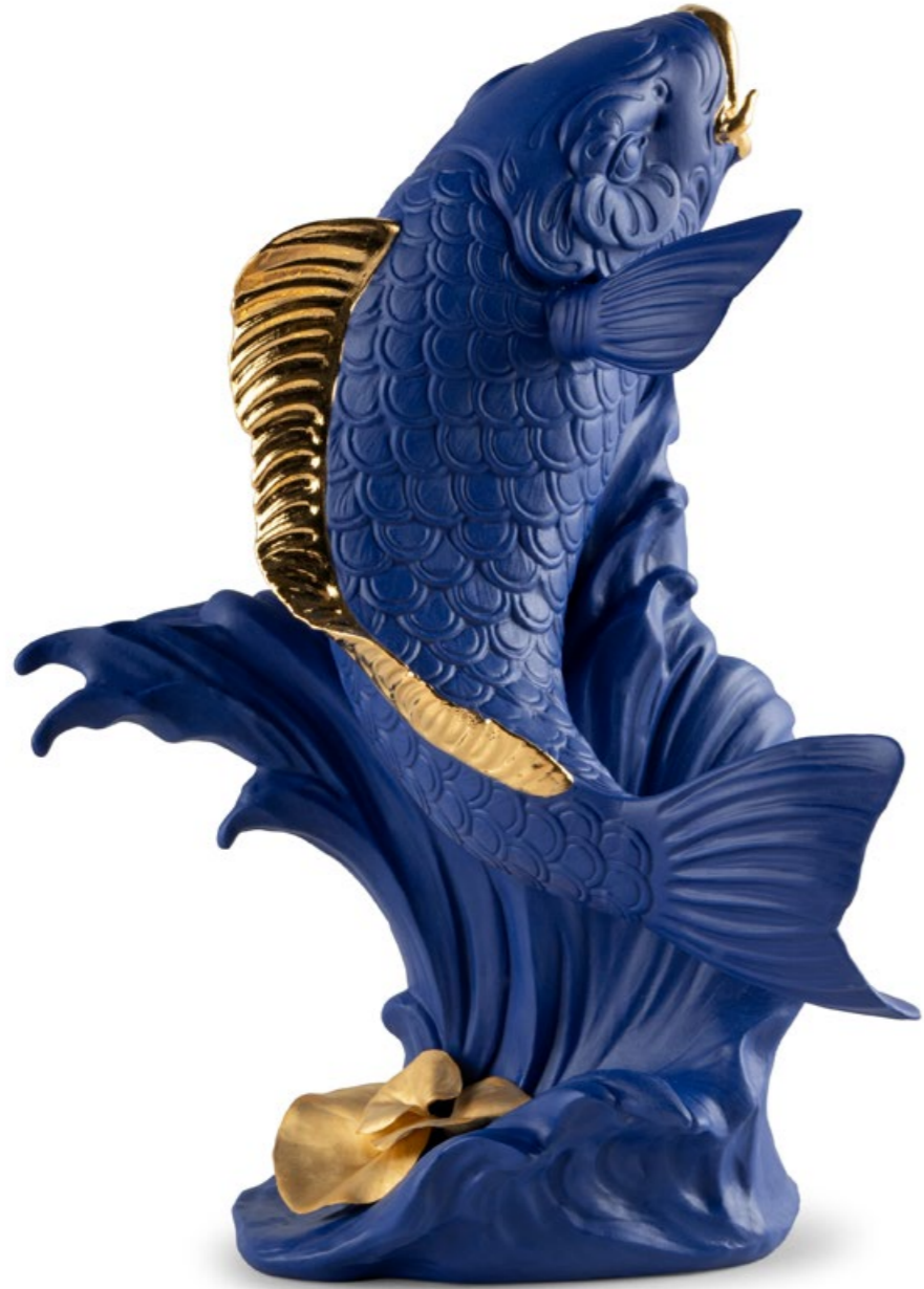
CARPA KOI (AZUL-DORADO) 01009579 31 x 21 x 24 cm Serie Limitada de 750 piezas

Las carpas koi simbolizan fortuna, paciencia y longevidad.