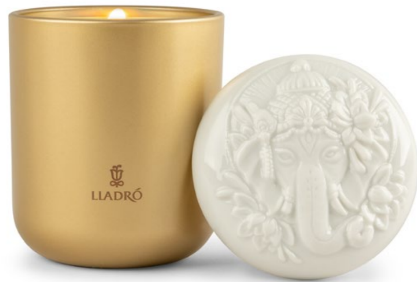
VELA LORD GANESHA - JARDINES DE VALENCIA 01040304 12 x 8 x 8 cm 200 g

Jardines de Valencia es un delicado perfume con notas cítricas y afrutadas de bergamota, nardo, sándalo y almizcle.