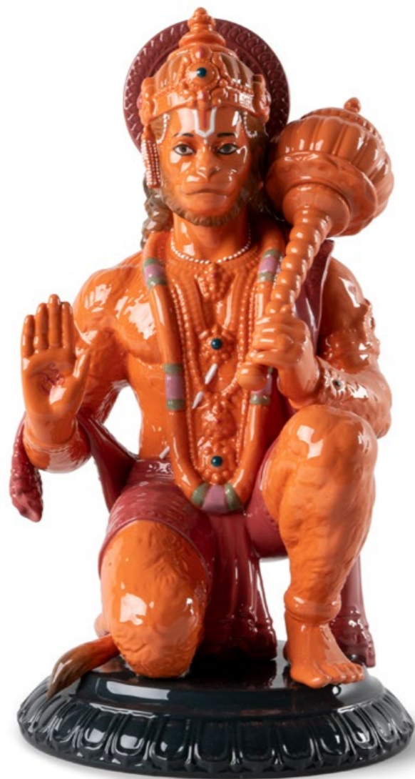
HANUMAN-NARANJA 01009557 27 x 15 x 15 cm

Esta edición especial de Hanuman: el Señor de los Monos, venerado por su coraje, erudición y lealtad, juega con la energía del color para hacerla aún más impactante. La gama cromática de naranjas y rojos se combina con una ejecución profusa en la que destacan pelaje, guirnaldas, collares, tocado o rostro. Y a la intensidad de estos colores se suman toques de blanco, marrón, verde o negro, que realzan el simbolismo de este venerado dios.