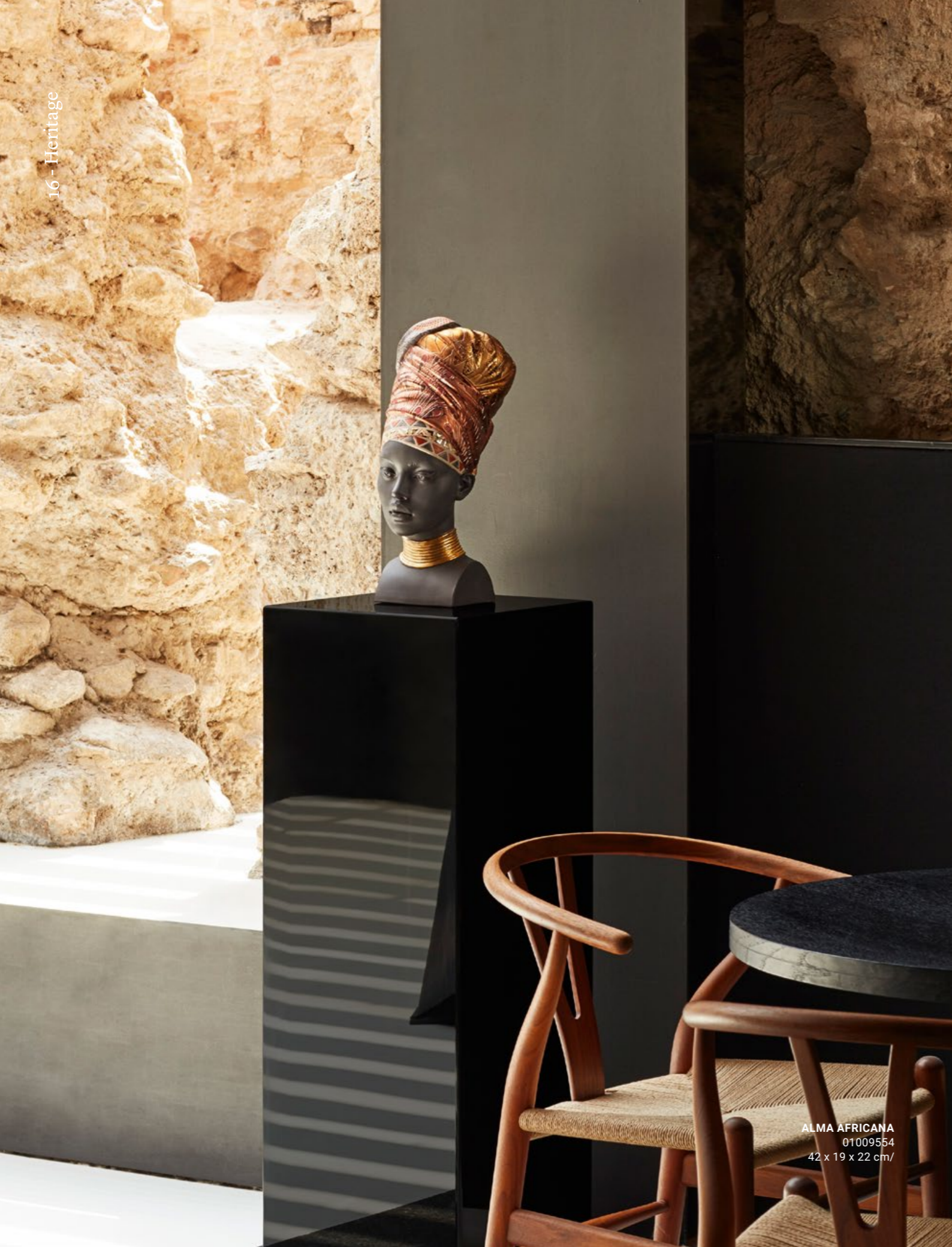
ALMA AFRICANA 01009554 42 x 19 x 22 cm/