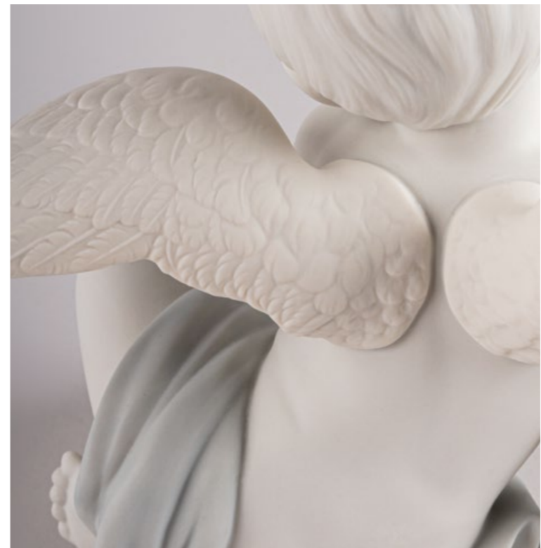
MOMENTOS ANGELICALES 01009568 20 x 26 x 18 cm

Una escena, elaborada en porcelana blanca mate con sutiles toques de color, que es todo dulzura.