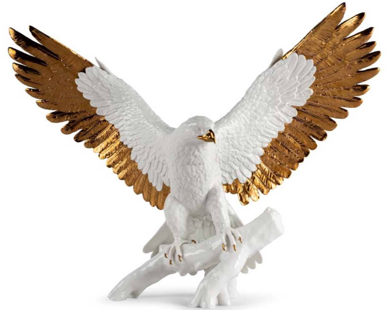
ÁGUILA (BLANCO-COBRE) 01009578 48 x 57 x 28 cm

La infinita diversidad de la fauna salvaje sirve de argumento para la colección Wild Soul , integrada por creaciones blancas decoradas con lustres metalizados, a la que se une esta espectacular águila.