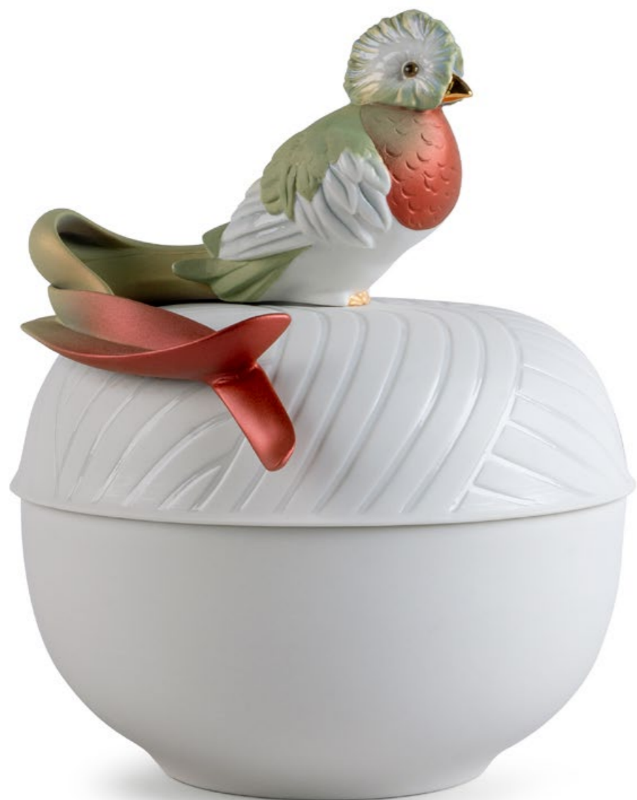
CAJA QUETZAL 01009650 26 x 21 x 20 cm

Objetos funcionales protagonizados por preciosas criaturas de las selvas tropicales. Caja Quetzal y Caja Colibrí combinan recipientes mate, con detalles de barniz que realzan las líneas del grabado de las tapas, con la riqueza cromática de las aves. Éstas decoradas con lustres y con pigmentos metalizados e iridiscentes en una rica gama de colores.