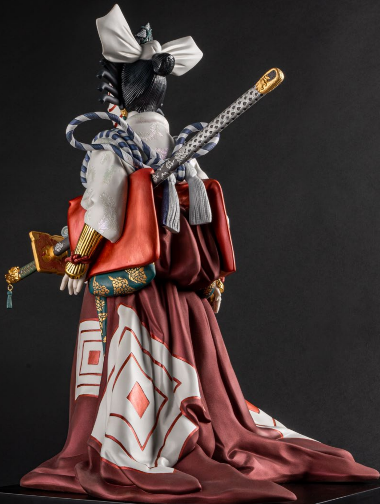
Alta Porcelana JAPAN-KABUKI 01002028 71 x 47 x 60 cm Serie Limitada de 250 piezas Peana incluida