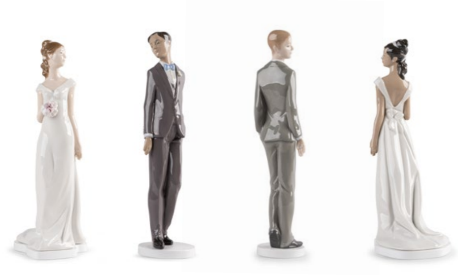
SOULMATES - NOVIA I 01009573 29 x 10 x 13 cm