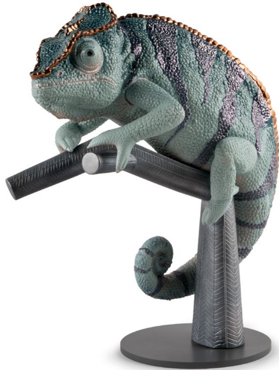
CAMALEÓN 01009564 30 x 24 x 13 cm

Lustre azules, cobre y perlados, más toques iridiscentes, se aplican sobre este camaleón que es un magnífico ejemplo de la maestría de los ornamentadores de la firma. Un equipo de expertos que graban a mano todos y cada uno de los detalles, en este caso, de la rugosa piel del animal y de la rama en la que se apoya. El resultado, un homenaje a estos particulares reptiles que con su capacidad de cambiar de color, personifican la capacidad de adaptación a cualquier entorno.